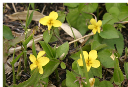
阿蘇外輪山に咲くキスミレ