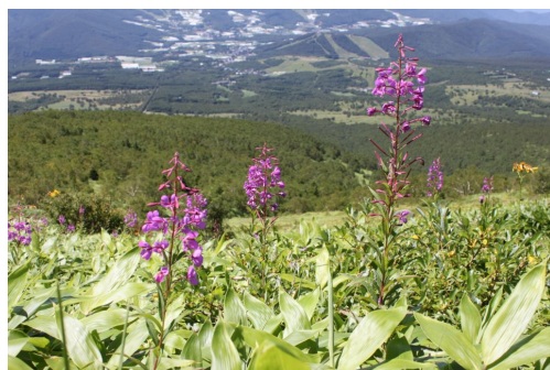
根子岳の草原に咲くヤナギラン