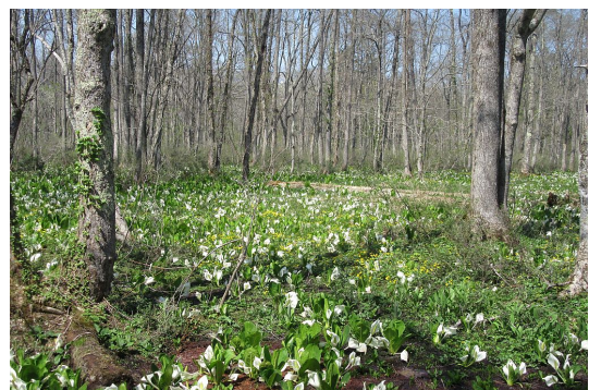
森林植物園のミスバショウ